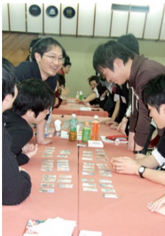
▲労組の目的などを織り込んだ「組合かるた」の作成中