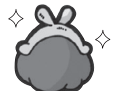
春に財布を新調すると金運アップにつながる

立春からひな祭りごろまでに財布を替える「春財布」張る財布の語呂合わせからか、金運が上昇すると言われています。