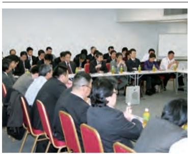
共済加入促進など各種取り組み確認 第11回分会長会議

第一回分会長会議が二月二四日に開かれた。会議では、二〇一〇春闘の取り組みの他、①労働時間適正化強化月間②カフェテリアプランのメニュー充実③「沙漠を緑に！」第一三次データ部の派遣者決定④データ部独自の共済加入促進キャンペーン(三月中旬下旬)——等について論議し取り組みについて意思統一した。