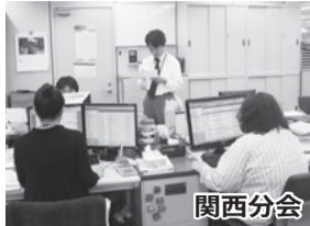
リフレッシュデー等に 職場巡回を実施 (2010.2のもよう)