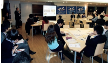
基盤システム・技術開発BS分会(アヒル)

現在、①春闘要求②データグループ事業への対応③組合活動の充実・強化(レクリエーション等)——をテーマに各職場で総対話を実施しています。必ず参加してください。