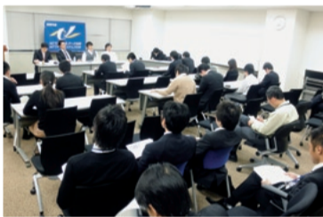
システム分会(アバンネット五反田NNビル)